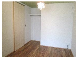
洋室 収納スペースを確保した6帖の洋室は、窓から差す自然な光がゆとりを感じさせる。