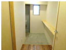
玄関 広々とした玄関土間スペースには飾り棚があり、自分好みのオシャレを演出できる。