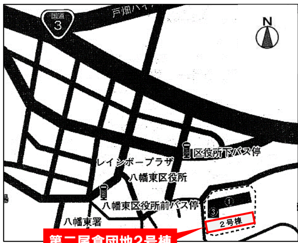
第二尾倉団地2号棟