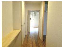
廊下 アカシア無垢材のフローリングと質感の良いクロスの壁紙が、あたたかみを感じさせる。