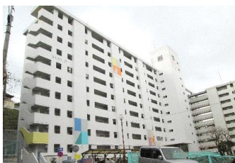
第二尾倉団地2号棟 外観