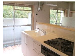
対面式カウンター付キッチン 住む人のコミュニケーションとコンパクトな生活動線を考えた明るいキッチンスペース。