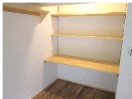
ワークスペース くつろぎの場所であるリビングの一角を有効活用し、勉強や仕事等、自分に合う様々な使い方ができる。