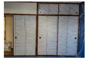
⑤襦りメイクシート貼