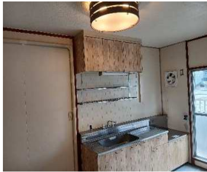
①台所シート貼・照明

入居率が低迷するエレベーターなし住棟の4階5階の空住戸について、可能な限り修繕費用を抑えた入居促進を目指すため、若手プロジェクトメンバーの柔軟な発想を取り入れて試行的にD I Yリノベーションを実施しました。実施にあたっては「NP0 法人北九州市営繕推進協力会」の指導・助言をいただきました。