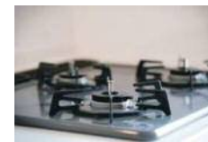
(キッチン) トクラスキッチン Bb コンパクト W1800 (レンジフード) 浅型レンジフード LIXIL/BFRF-621W

屋内に洗濯機を設置する。上部には棚を取り付け洗濯用品の収納も確保。バルコニーと脱衣室の動線の中央でもあり洗濯中はリビングでテレビを見ながら待ち洗濯が終わったことにも気づきやすい配置。