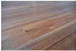
アカシア無垢フローリング

アカシア無垢材のフローリングやウィリアムモリスの壁紙を使用し、あたたかみのある優しい生活空間へ。