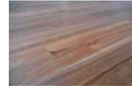
アカシア無垢フローリング

アカシア無垢材のフローリングやウィリアムモリスの壁紙を使用しあたたかみのある優しい生活空間へ。