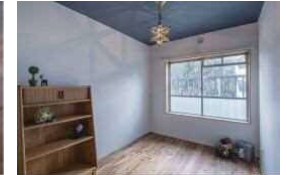
ウィリアムモリスの壁紙 (天井部)

天井のクロスのみアクセントのウィリアムモリスクロスを使用。壁のクロスは量産クロスとし、貼替時のコストを抑える。