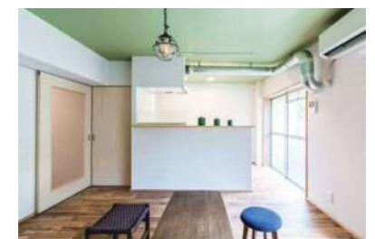
(モニター付きインターホン) Panasonic/VL-SV26KL-W