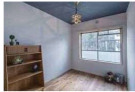
ウィリアムモリスの壁紙(天井部分)