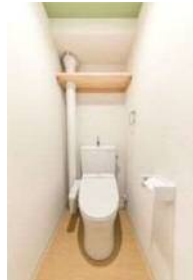
(トイレ) TOTO (シャワートイレ) TOTO