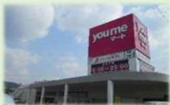
ゆめマート曾根店