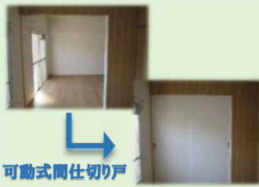
可動式間仕切り戸